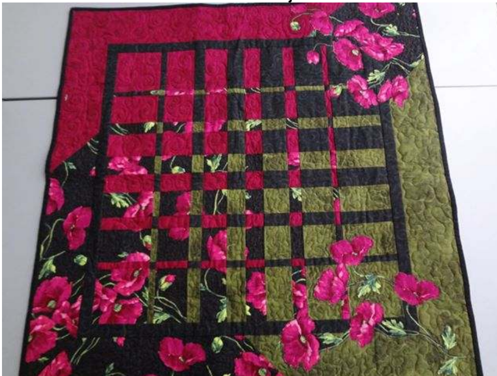
Obr. Autor: Majka

Lekcia č.8: Zmes 4 farieb a jej prechody – rýchlym a efektným spôsobom zmiešate štyri rôzne farby tak, aby celok pôsobil harmonicky. Prípadná aplikácia jeho pôsobenie ešte umocní.... techniku môžete použiť ako stred zaujímavej prikrývky, obrázok na stenu či obrus na stôl. Výsledkom lekcie je blok vo veľkosti 80x80cm Späť