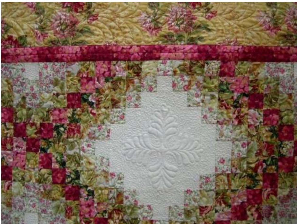
Obr. Inšpirácia pre techniku z internetu

Lekcia č.6: Nekonečná cesta. Zrýchlený spôsob pre vytvorenie efektných farebných prechodov z farby do farby. Technika vhodná na prikrývky postele, obrazy, vankúše či akcent tašky... výsledkom techniky je blok vo veľkosti 80x80cm Späť