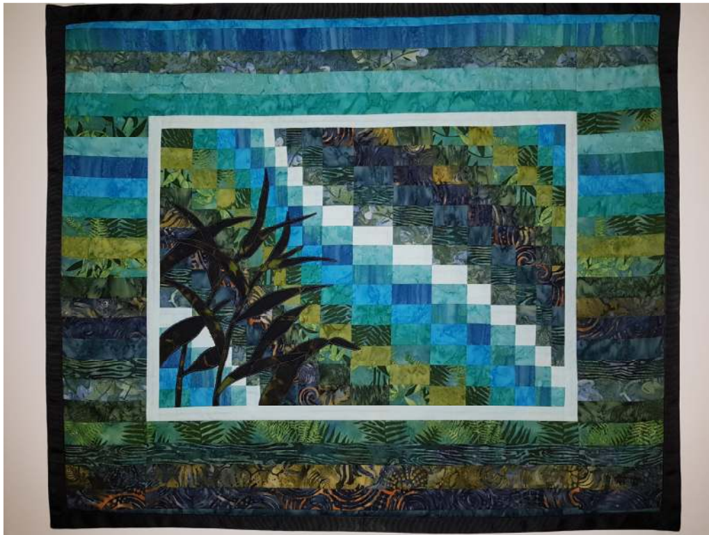
Obr. Autor Zuzka S. na kurze AZ2

Lekcia č.9: Pásky a ich prelínanie.... veľmi efektné geometrické vzorovanie. Zrýchlená technika so súčasným sendvičovaním. Ako si vypočítať svoju krivku ? Ako naladiť farby tak, aby bol výsledok zaujímavý? To všetko sa dozviete na lekcii č.9. Výsledkom je blok vo veľkosti 30x45cm Späť