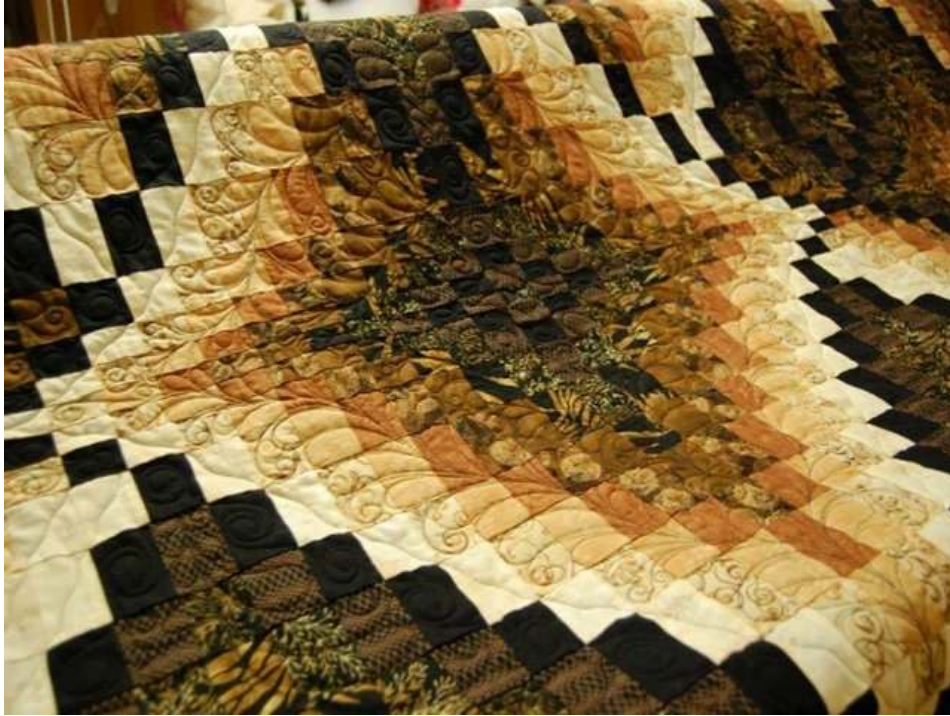
Obr. Inšpirácia pre techniku z internetu

Lekcia č.6: Nekonečná cesta. Zrýchlený spôsob pre vytvorenie efektných farebných prechodov z farby do farby. Technika vhodná na prikrývky postele, obrazy, vankúše či akcent tašky... výsledkom techniky je blok vo veľkosti 80x80cm Späť