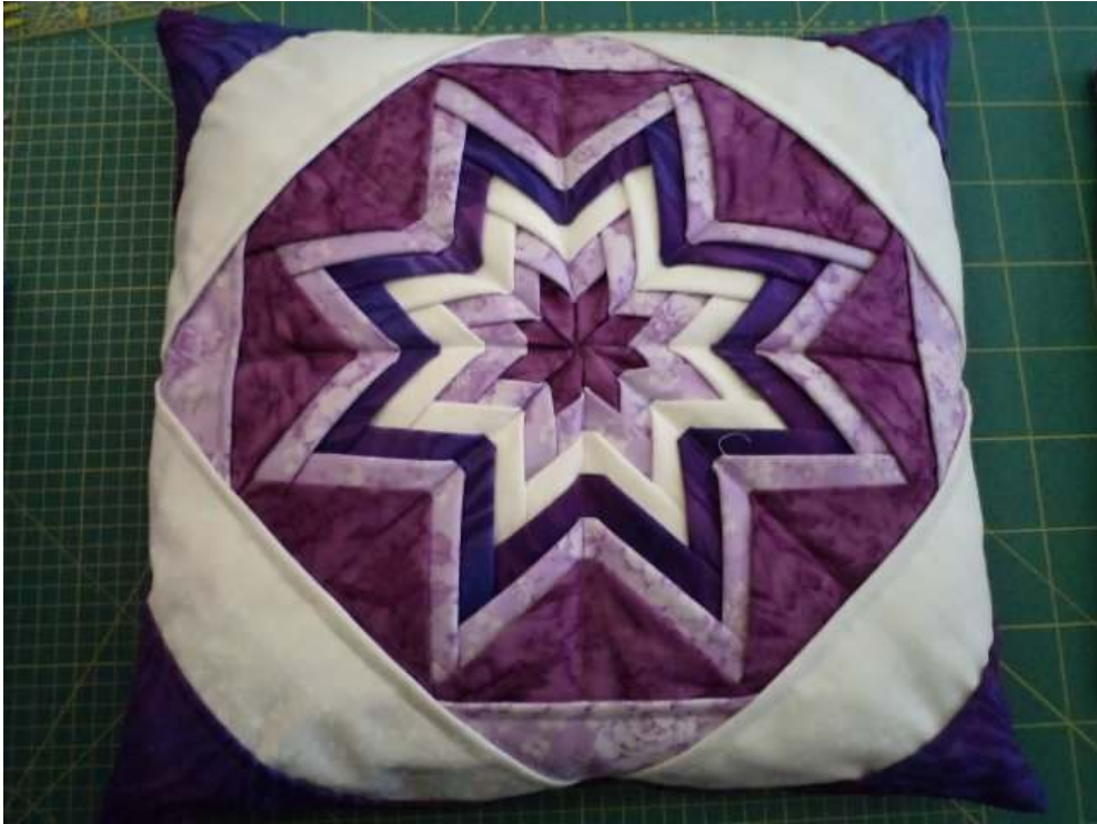
Obr. Autor: Gizela

Lekcia č.2 - Skladané obrázky – naučíte sa rýchlu plastickú techniku, ktorou možno efektne vyzdobiť vankúšiky či zhotoviť originálne tašky. Taktiež je vhodná na plastické obrázky, či vianočné pohľadnice. Pozriete sa na rôzne farebné riešenia. Výsledkom tejto lekcie je blok vo veľkosti vankúša Technika je vhodná aj pre úplných začiatokov! Späť