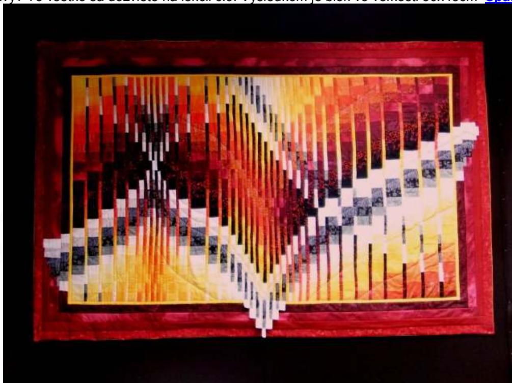
Obr. Autor: Anka Z.

Lekcia č.9: Pásky a ich prelínanie.... veľmi efektné geometrické vzorovanie. Zrýchlená technika so súčasným sendvičovaním. Ako si vypočítať svoju krivku ? Ako naladiť farby tak, aby bol výsledok zaujímavý? To všetko sa dozviete na lekcii č.9. Výsledkom je blok vo veľkosti 30x45cm Späť