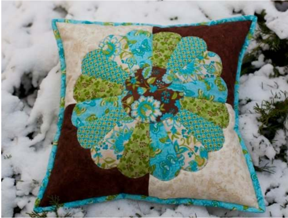
Obr. Ukážka techniky z internetu

Lekcia č.1 – rýchle vankúše. Postup a ukážky rôznych farebných riešení a rôznych využití tejto rýchlej a ľahkej techniky. Na kurze si zhotovíte blok vo veľkosti vankúša, obrúbite ho pomocou inofarebnej paspulky a ušijete zadnú stranu vankúša. Pomocou tejto techniky môžete ozdobiť aj tašku, štólu na vianočný stôl, štvorcový obrus, prestieranie či deku na posteľ. Technika je vhodná pre úplných začiatokov! Späť