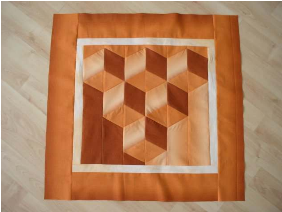
Obr. Autor: Valika B.

Zrýchlený postup priestorového spracovania rôznych zoskupení kociek. Rôzne farebné riešenia a rôzne využitie danej techniky na vankúše, tašky či dokonca deky. Výsledkom lekcie je blok vo veľkosti vankúša. Späť