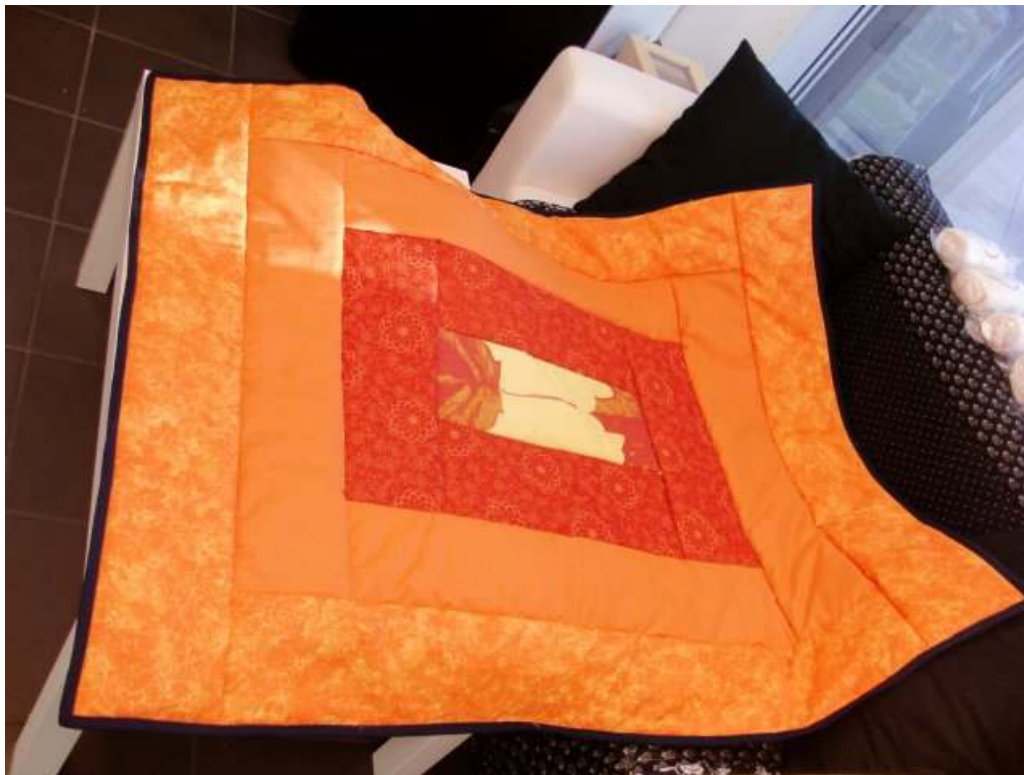
Obr. Autor – Valika B.

Lekcia 3 – Ako ušit' deku za 6 hodín. Finta, ktorá Vám pri šití diek výrazne uľahčí prácu. Navyiac, v jednom pracovnom postupe zhotovíte dve farebne odlišné verzie toho istého výrobku. Napríklad kvetinovú alternatívu pre letné slnečné dni a melancholickú pre sychravé jesenné rána....výsledkom lekcije je deka na jednolôžko Späť