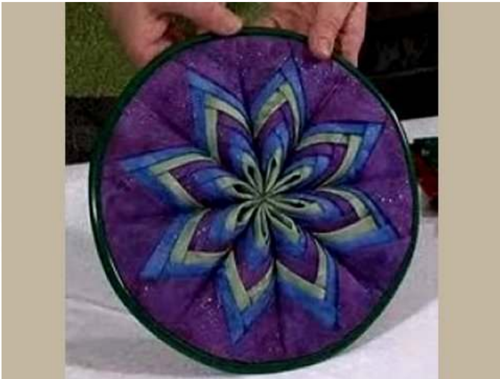
Obr. Ukážka techniky z internetu

Lekcia č.2 - Skladané obrázky – naučíte sa rýchlu plastickú techniku, ktorou možno efektne vyzdobiť vankúšiky či zhotoviť originálne tašky. Taktiež je vhodná na plastické obrázky, či vianočné pohľadnice. Pozriete sa na rôzne farebné riešenia. Výsledkom tejto lekcie je blok vo veľkosti vankúša Technika je vhodná aj pre úplných začiatokov! Späť