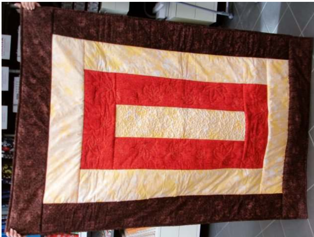
Obr. Autor: Jarka F.

Lekcia 3 – Ako ušit' deku za 6 hodín. Finta, ktorá Vám pri šití diek výrazne uľahčí prácu. Navyiac, v jednom pracovnom postupe zhotovíte dve farebne odlišné verzie toho istého výrobku. Napríklad kvetinovú alternatívu pre letné slnečné dni a melancholickú pre sychravé jesenné rána....výsledkom lekcije je deka na jednolôžko Späť