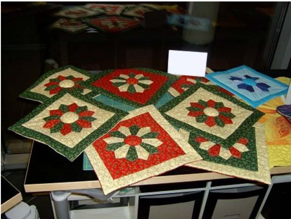
Obr. Autor: Jojka J. a jej vianočné vankúšky

Lekcia č.1 – rýchle vankúše. Postup a ukážky rôznych farebných riešení a rôznych využití tejto rýchlej a ľahkej techniky. Na kurze si zhotovíte blok vo veľkosti vankúša, obrúbite ho pomocou inofarebnej paspulky a ušijete zadnú stranu vankúša. Pomocou tejto techniky môžete ozdobiť aj tašku, štólu na vianočný stôl, štvorcový obrus, prestieranie či deku na posteľ. Technika je vhodná pre úplných začiatokov! Späť