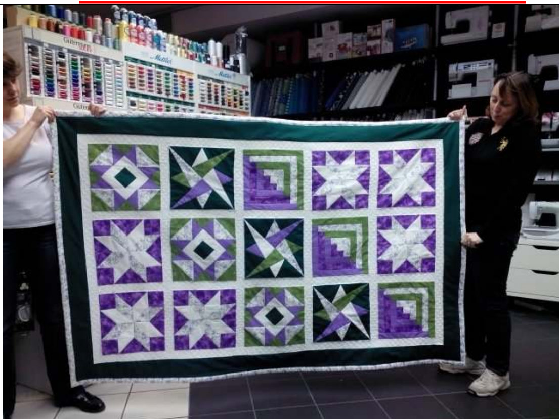
Veľkosť výslednej deky si každý volí sám - tu jednolôžko