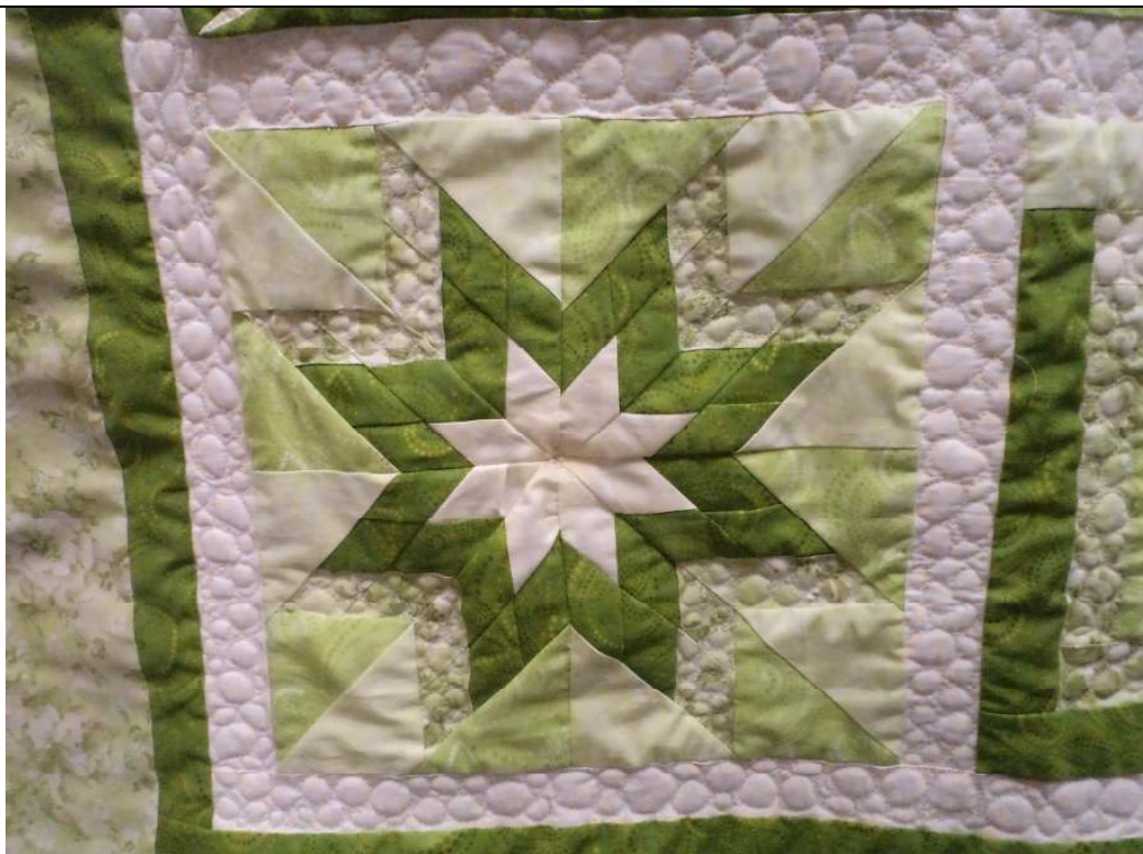
AZI a Zuzkin výsledok