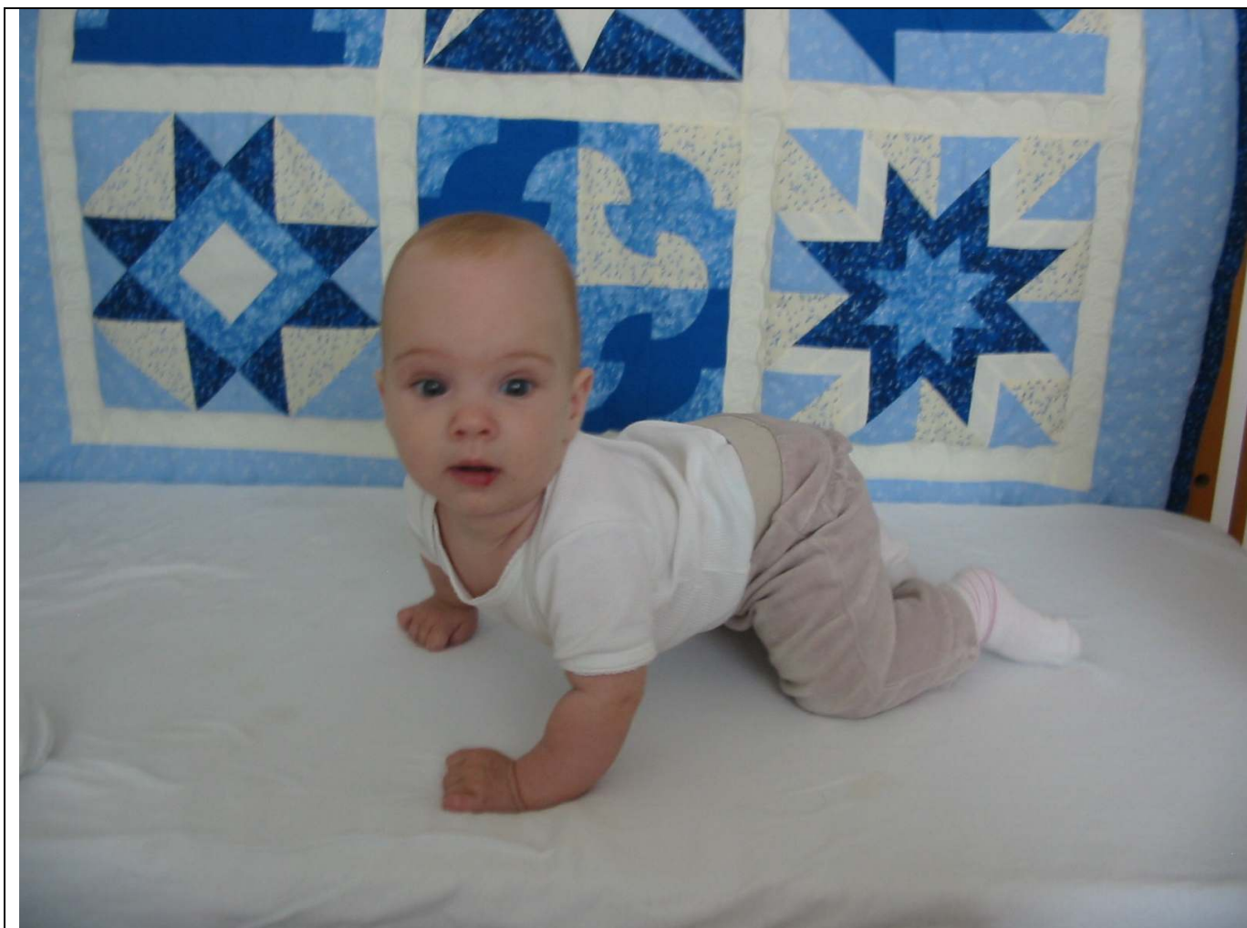
A táto malá fešanda navštevovala náš kurz Patchwork AZ1 v brušku maminky ....