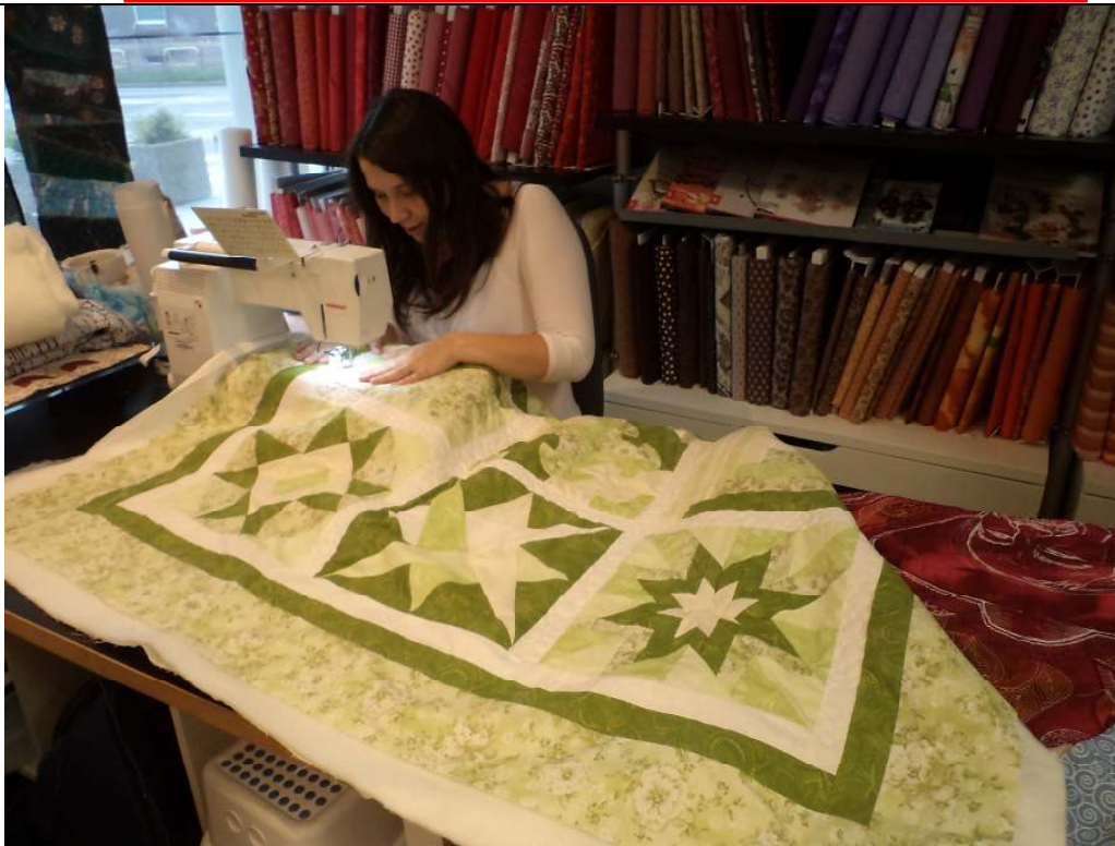
AZI a Zuzka v akcii...