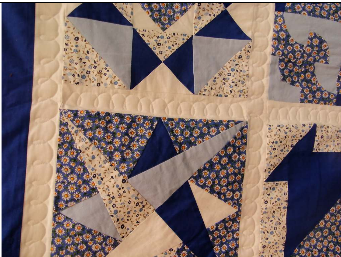
Kurz AZ1 – Martinka – ukážka voľného quiltovania