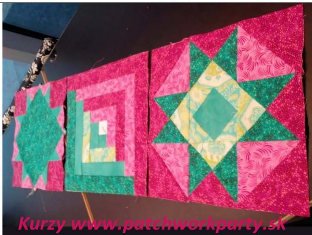
Na Sobotných kurzoch patchworkparty Saška, Sobota č.1