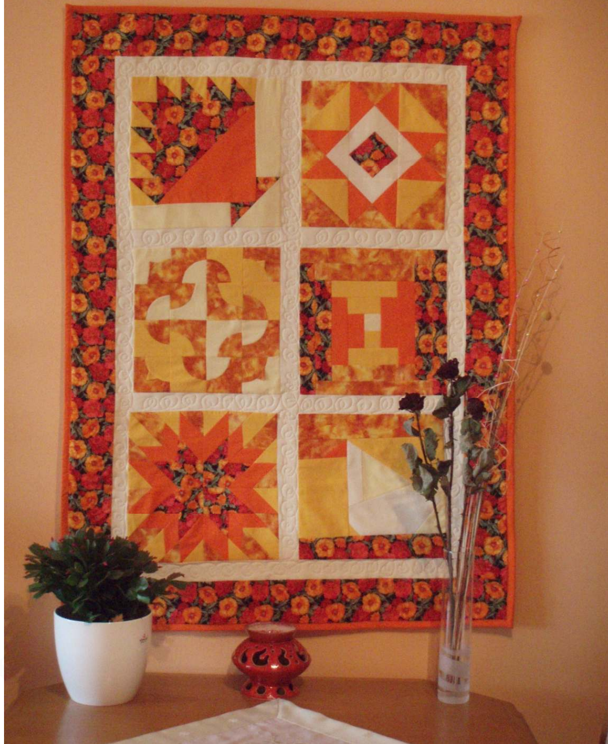
Kurz AZ1 – Ivetka