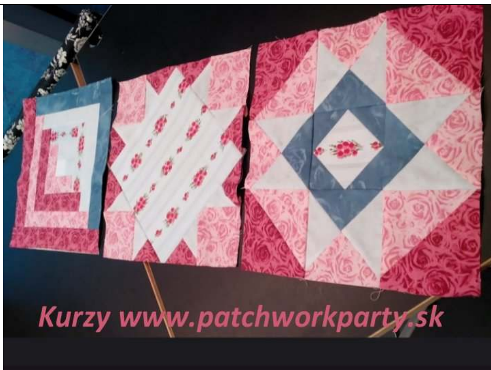
Na sobotných kurzoch Patchworkparty Majka – Sobota č.1