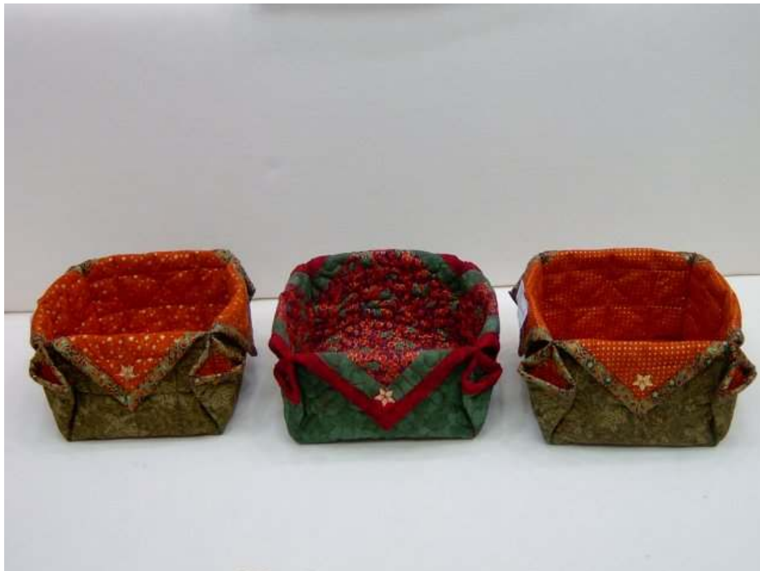
Lekcia č.1: Vianočné boxy na pečivo či sladkosti