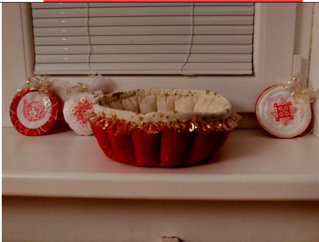
Lekcia č.4 – nádoba na vianočný stôl