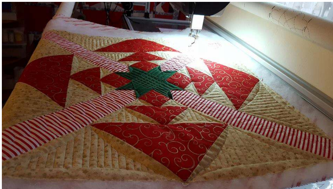
Lekcia č.6 Vianočná technika s rýchlym výsledkom - top hotový za 2-3 hodiny