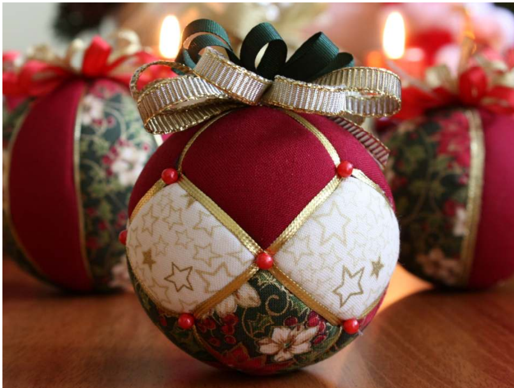
Lekcia č.3: Vianočné gule a iné ozdoby z textílií