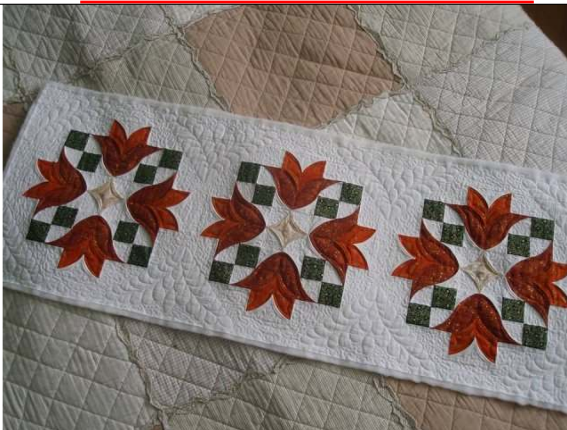
Lekcia č.5 – Kvetinové Vianoce – technika vhodná na štólu, vankúš, prestieranie