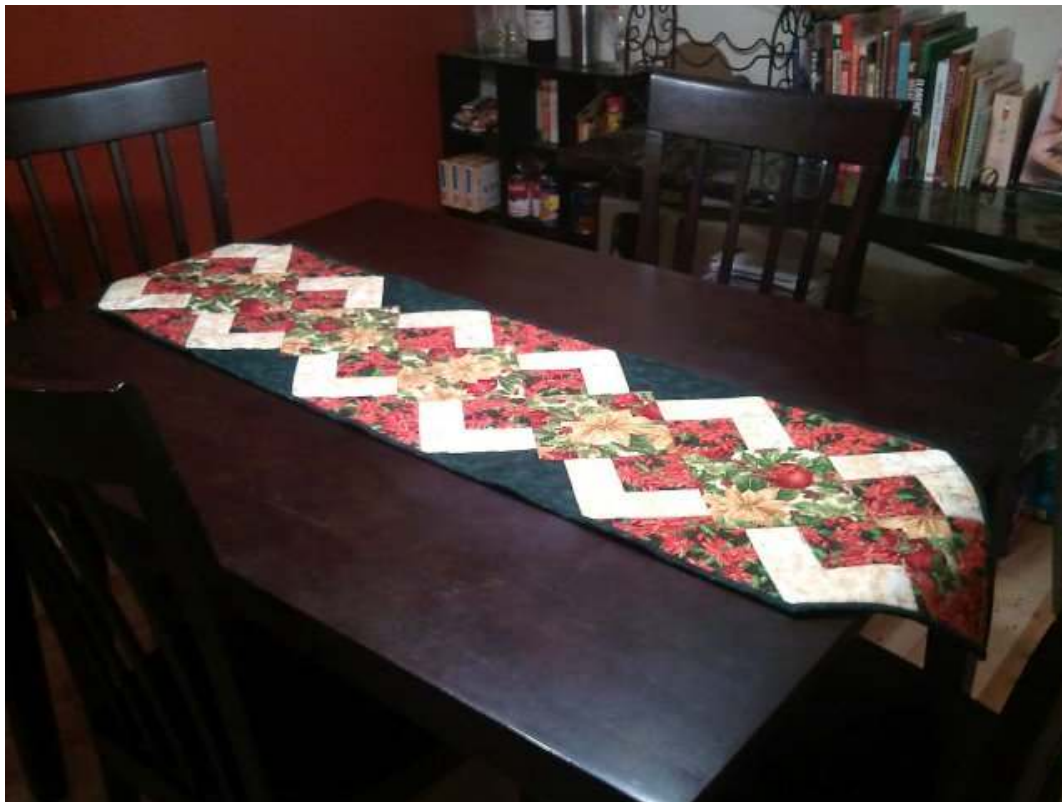
Lekcia č.2 - Slávnostná štóla na vianočný stôl – zrýchlená technika